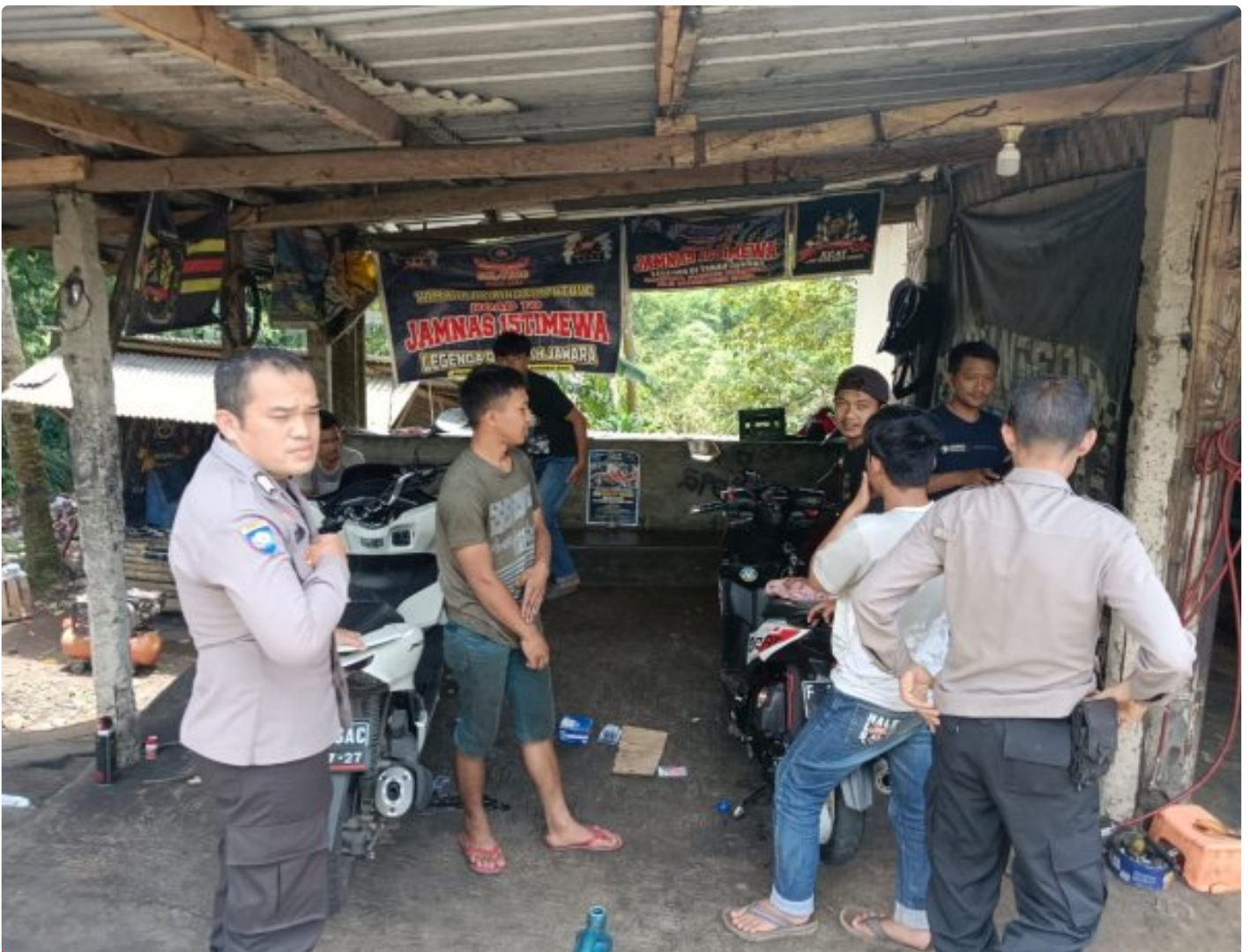
Polsek Sukabumi Polres Sukabumi Kota

Kota Sukabumi – Polres Sukabumi Kota Polda Jawa Barat – Antisipasi tindak kejahatan dan geng motor balap liar, Polsek Sukabumi menggelar razia Knalpot