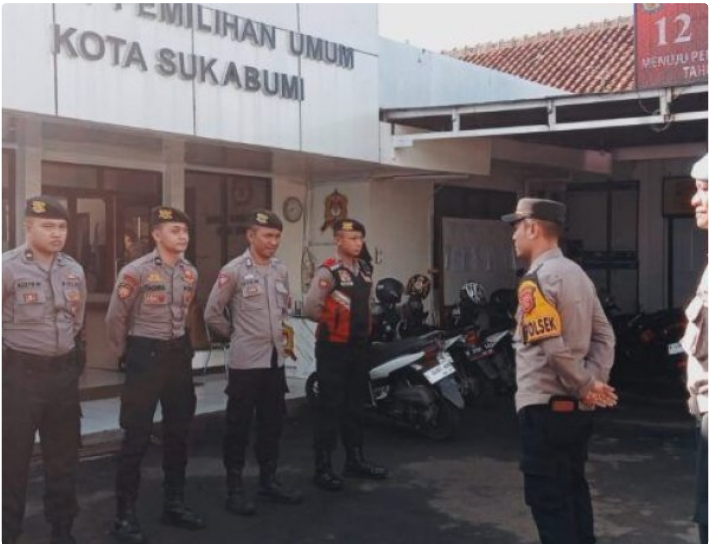
Polsek Citamiang Polres Sukabumi Kota

Kota Sukabumi – Polres Sukabumi Kota Polda Jawa Barat – Guna pastikan aman, Polsek Citamiang Polres Sukabumi Kota menempatkan personilnya untuk